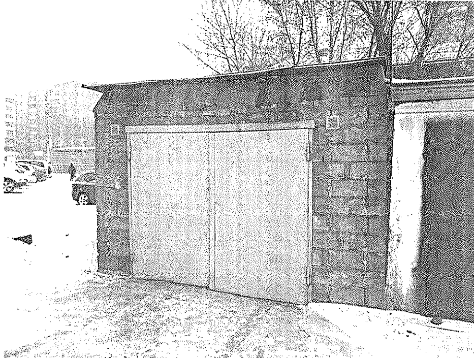
Гараж № 1

Объект капитального строительства – гаражный бокс из бетонных блоков на землях неограниченной государственной собственности в границах кадастрового квартала 24:50:0200202, расположенных восточнее земельного участка с кадастровым номером 24:50:0200202:30 по адресу: Красноярский край, г. Красноярск, Железнодорожный район, ул. Ломоносова, 102