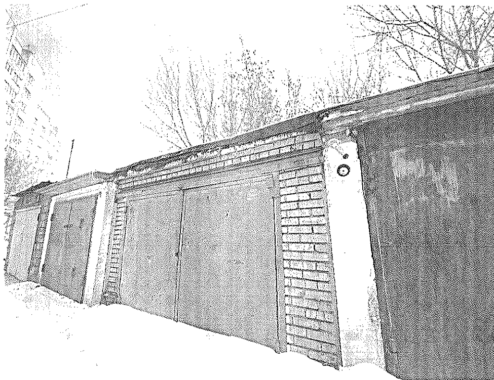
Гараж № 2

Объект капитального строительства – кирпичный гаражный бокс на землях неразграниченной государственной собственности в границах кадастрового квартала 24:50:0200202, расположенных восточнее земельного участка с кадастровым номером 24:50:0200202:30 по адресу: Красноярский край, г. Красноярск, Железнодорожный район, ул. Ломоносова, 102